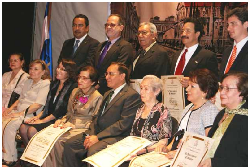
Autoridades, ex rectores y representantes de otros ex funcionarios universitarios en fotografía oficial del evento.