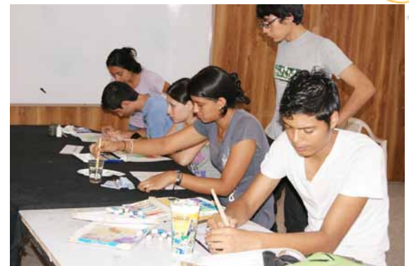
Métodos. Estudiantes de nuevo ingreso aprenden técnicas de pintura y dibujo.

Finalmente, mencionó “la Escuela de Artes cuenta con los recursos humanos que pueden ser aprovechados en el refuerzo académico, los estudiantes queremos colaborar con la Escuela