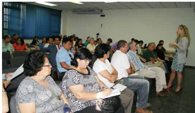
Taller. Docentes de diferentes unidades académicas participan en taller.