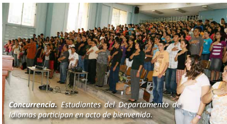
Concurrencia. Estudiantes del Departamento de Idiomas participan en acto de bienvenida.

La actividad se realizó el pasado jueves 23, en el Auditorium 4 de la Facultad.